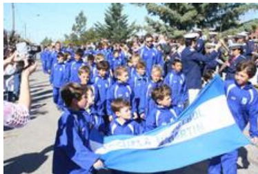
La Banda Municipal 'Bartolomé Meier' recibió una distinción de parte de la Delegación Municipal de Pueblo Santa Trinidad, y además deleitó a los presentes durante el desfile cívico.