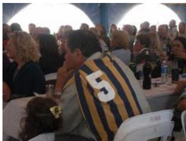
Todo un símbolo, el hombre comió, bailó y disfrutó con la camiseta del club colgada de sus espaldas.

“Y volveré, como el ave que retorna a su nidal”, comenzó cantando el grupo “Ayer nomás” y quizás sin saberlo el cantante estaba dando marco al significado profundo que para la mayoría de los presentes tenía el festejo de los cincuenta años del Club Rural La Ventura, una institución nacida a la sombra de uno de los hechos políticos más trascendentes de la historia lugareña, tal como lo fue la colonización de La Ventura, acaecida hace 51 años por voluntad del por entonces gobernador de la provincia de Buenos Aires, doctor Oscar Alende.