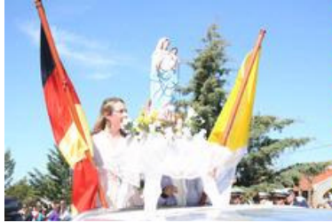
Pueblo Santa Trinidad tuvo su festividad religiosa de Kerb, en las cuales siempre estuvo presente la Madre de todos, la Virgen María.