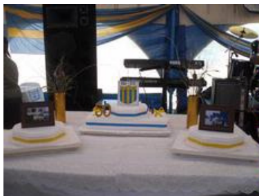
Una torta espectacular presentó la comisión directiva para compartir el festejo por las Bodas de Oro del Club