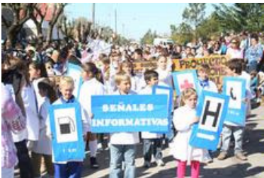
El tránsito y las señales para mejorarlo fueron el motivo de una escuela... y por suerte, es el de muchas.

Una nota de color la puso la escalera para subir al palco que era demasiado alta, lo que motivó que las mujeres, que subían al lugar con zapatos con taco, debieran extremar los cuidados para no tropezar.