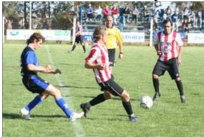
Con dos goles de Cuello, San Martín –ST- le ganó 2 a 1 a San Martín de Carhué, que terminó con 8 jugadores.