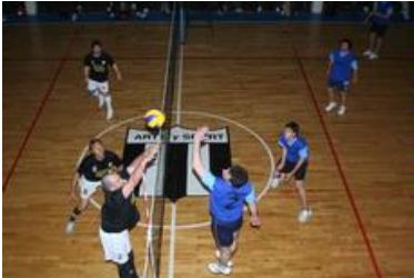
El equipo masculino de Blanco y Negro derrotó 3 a 0 al de Sociedad Cosmopolita (foto), en uno de los tres partidos que se jugaron en la víspera.

Deportivo Sarmiento sigue puntero en varones, mientras que Blanco y Negro quedó solo en mujeres.