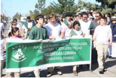
Integrantes de la Asociación Civil de Actividades Ecuestres y Terapéuticas de nuestra ciudad, desfilaron ayer en la Kerb del primer pueblo alemán.