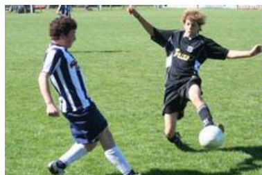
Categorico. Blanco y Negro goleó 4 a 1 a Club Sarmiento en 6ª (foto), en partido jugado en el Parque Felisa I. de Alberdi.

El Progreso e Independiente no se sacaron ventajas. En la zona "A" del torneo Clausura Club Sarmiento "A" es nuevo líder en 8ª, mientras que en la zona "B" Racing quedó como único puntero en 6ª.